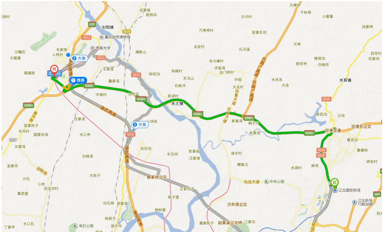
重庆江北国际机场至海宇酒店路线图

乘轻轨：约39.6公里，2小时，可乘轨道交通3号线至红旗河沟车站，换乘轨道交通6号线至状元碑车站，步行3分钟至海宇温泉大酒店。